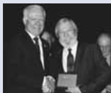
D r Raymond Rivest