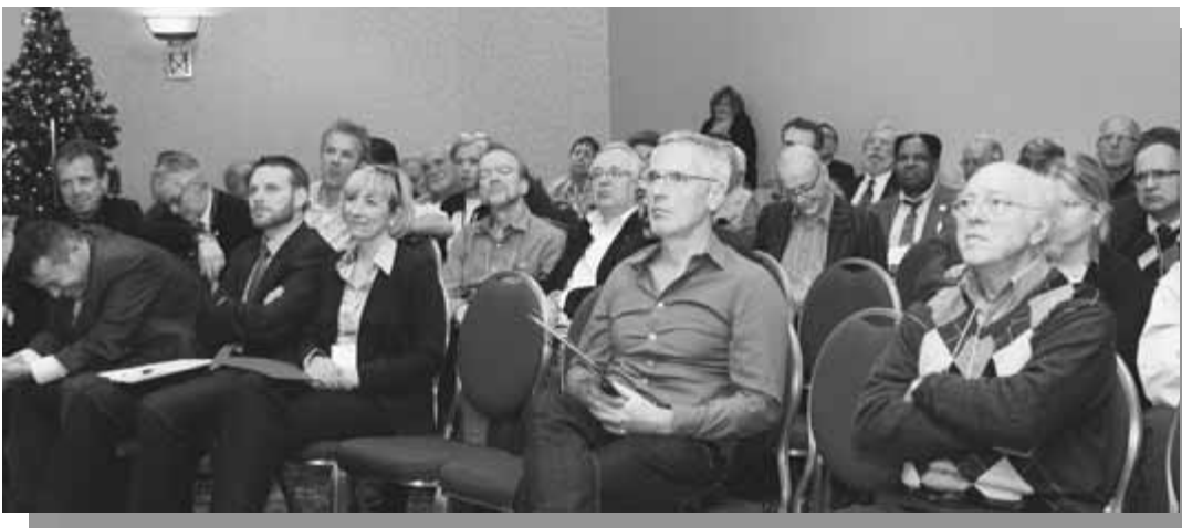
Assemblée générale de l'AMOM